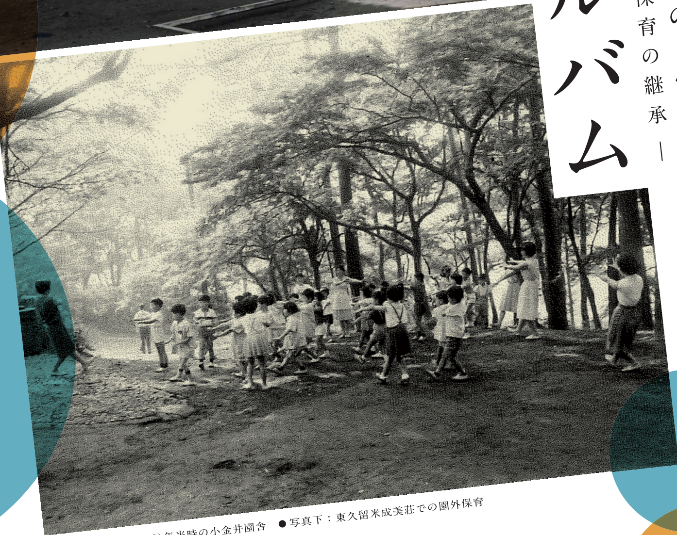
●写真上：1957(昭32)年当時の小金井園舎 ●写真下：東久留米成美荘での園外保育