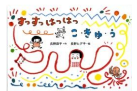
『すっすっはっはっ こきゅう』