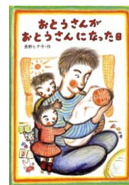
『おとうさんが おとうさんになった日』