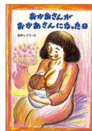
『おかあさんが おかあさんになった日』