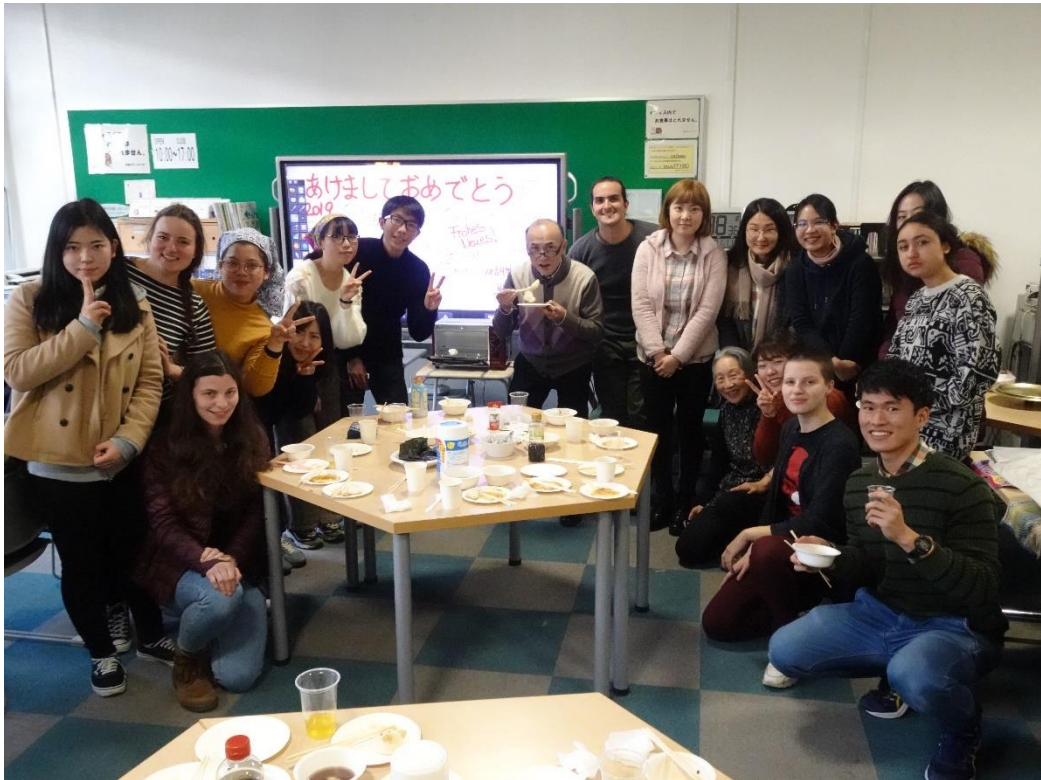
1/17 もちパーティ 日 7、留 15、計 22

全体所感：留学生カフェと名前を変えて、初めてのカフェだったが、全体としては、留学生がコンスタントによく来てくれたと思う。国、地域の紹介もそれぞれの学生が工夫を凝らしてやってくれてこれまでにない独創的で面白い発表が多かった。南アメリカやアフリカの発表などはこれまでなかったので非常に興味深かった。また、日本人の留学経験者も参加してくれて、留学報告などもしてくれたので、来た学生の留学への動機づけにも役立ったのではないだろうか。ただ、後半からは参加が少なくなり、日本人学生のコンスタントな参加があまりなかったのが残念、自由交流の会話が 2 回あったがその回は学生も少なかったが、その分、一つのテーブルでゆっくりコミュニケーションできたのはよかったかと思う。最後のもちパーティでは、準備過程で 5~6 人の学生が来てくれ、これまで来たことのない留学生もたくさん来てくれてよかったと思う。今回は、学生スタッフがいなかったのが残念だったが、学生スタッフ主導のカフェにしていければいいかと思う。