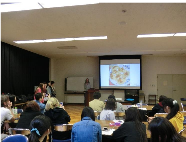
・世界の料理（ポーランド）