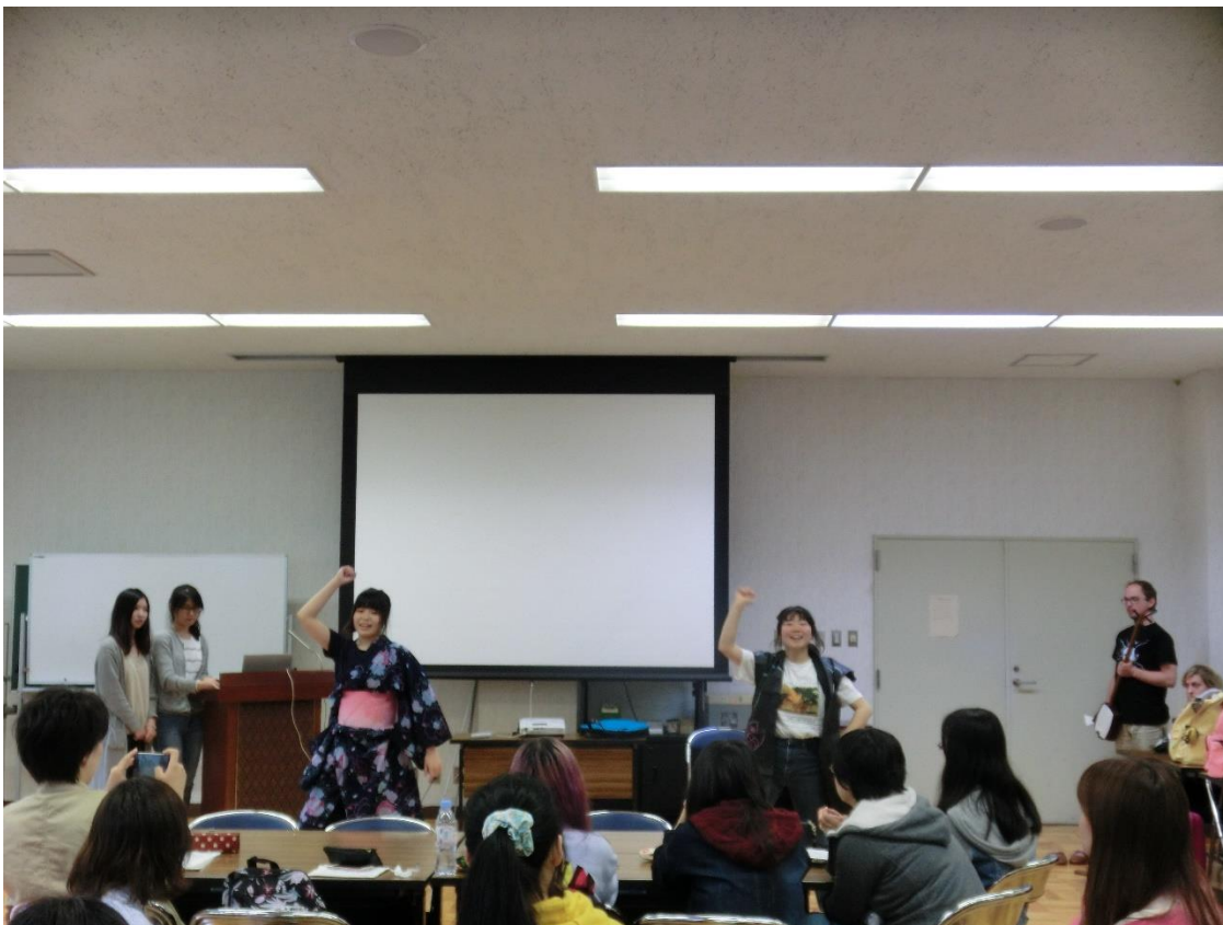
・ よさこい節でしめ～！