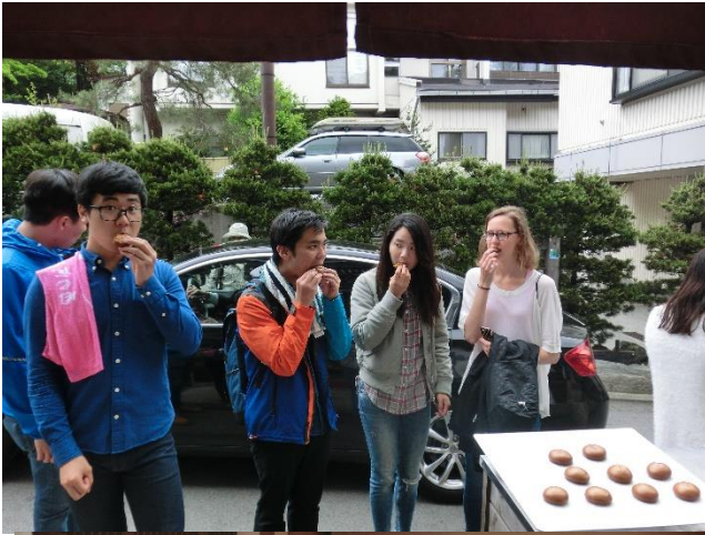
・温泉まんじゅうをタダでパクリ。