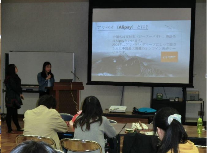
・中国の携帯電話の支払いについて