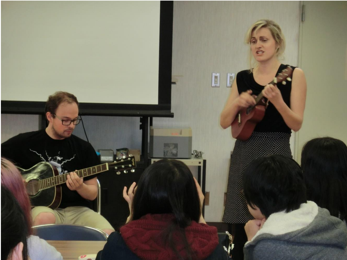
・ ギターとウクレレで、クロアチアの歌を熱唱。