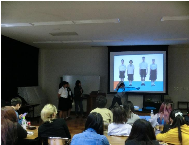
・タイの学校の制服