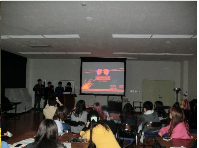
・各国恐怖文化体験（世界のお化け）