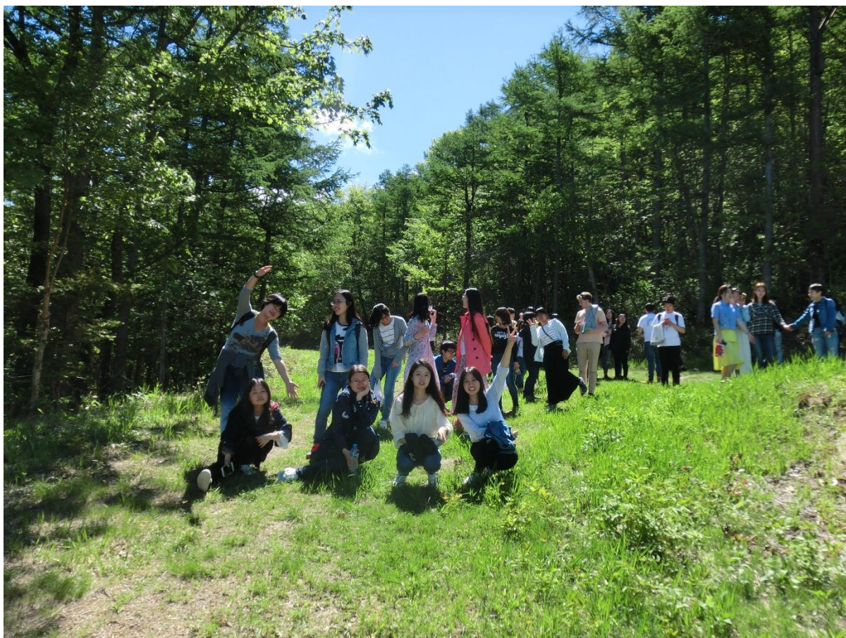
19 時頃 大学到着