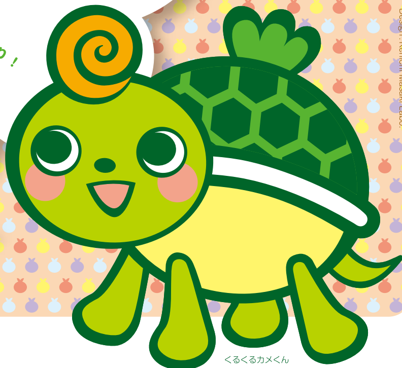
くるくるカメくん

楽しく作り! 美味しく食べて! 何ができるか? いっしょに参加して 考えましょう!