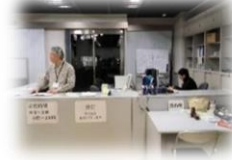
インフォメーションホール