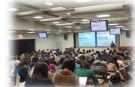
教師力養成特別講座