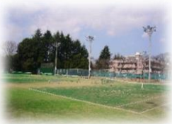
北門テニスコート人工芝化