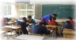
学生ボランティア