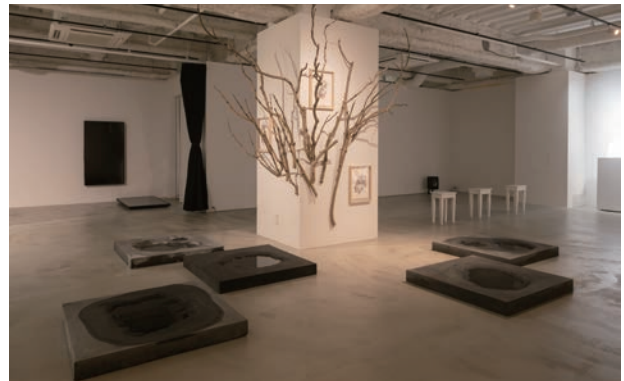
KUMA experiment 2022-2023