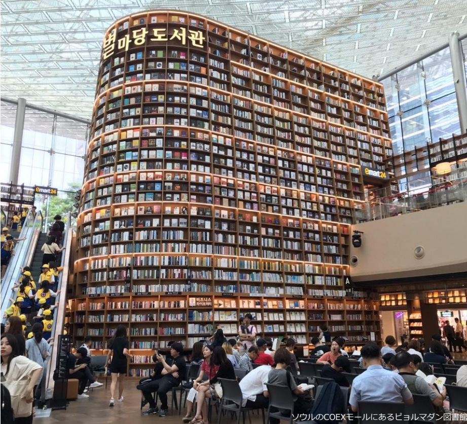
ソウルのCOEXモールにあるピョルマダン図書館