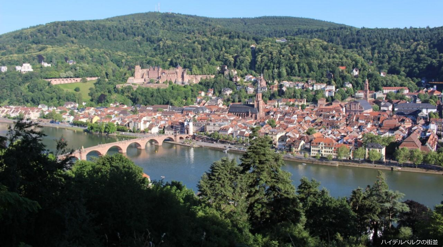
ハイデルベルクの街並