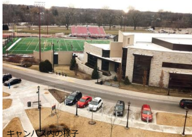
キャンパス内の様子

学部生のほとんどがキャンパス内の寮で暮らしており、留学生も入居できる。※寮費は2人部屋で年間約$12,648(週14食込み)。(食事代はミールプランによる。)