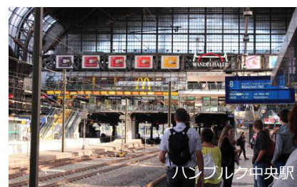
ハンブルク中央駅

寮 寮、又は一般家庭や学生アパートへの入居となる可能性もある。寮は月300～450€程度。